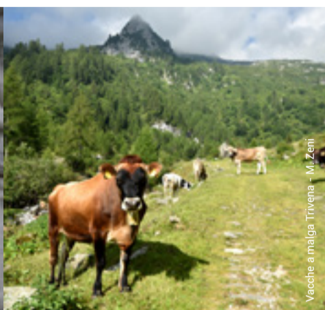
Vacche a malga Trivena - M. Zeni