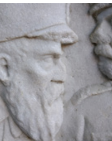
Bassorilievo, cimitero monumentale di Bondo - G. Pincelli

Sul territorio, percorrendo i vari sentieri, si incontrano i ruderi di altre malghe abbandonate o trasformate, come malga Valagosta e malga Acquaforte .