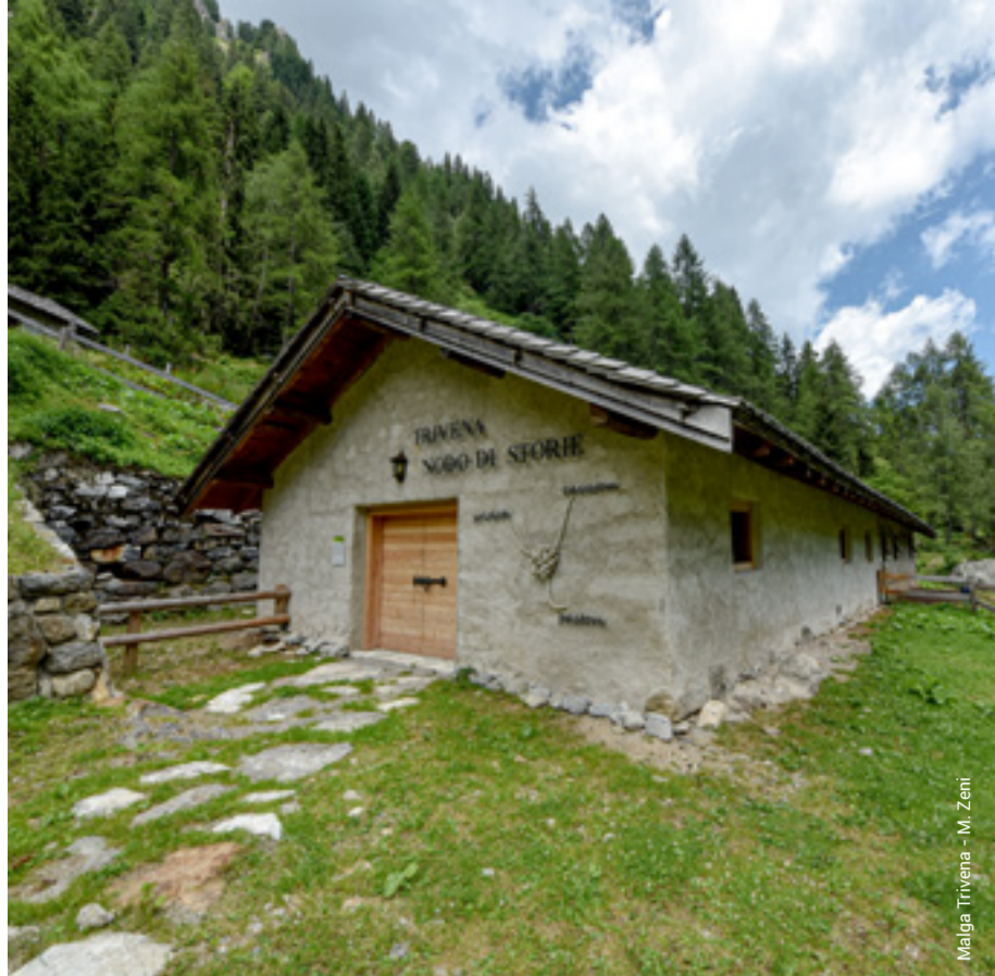
Malga Trivena - M. Zeni

Un edificio tradizionale, lo stallone della malga, è diventato il biglietto da visita di una valle intera ricca di storia, cultura, lavoro, natura, acqua e una grande varietà di rocce. Aprire il portone della grande stalla significa affiancarsi al pastore nell'ora della mungitura, ascoltare la voce degli oggetti che parlano di guerra e, un po' oltre, incontrare le parole che evocano polvere di marmo, arte e bellezza. Tutto questo è reso attuale e vivo dal fragore del torrente che, seguendo il ciclo dell'acqua, ritorna a scorrere nello stesso luogo.