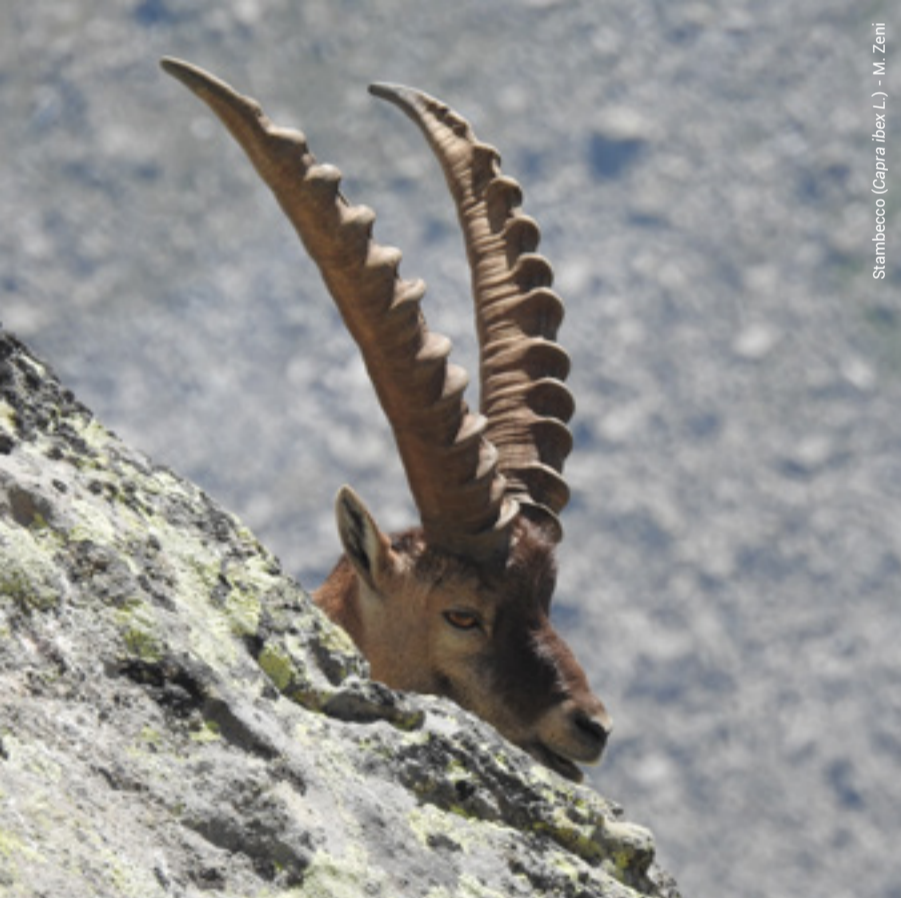
Stambecco (Capra ibex L.) - M. Zeni

Percorrendo i sentieri dal fondovalle, si incontrano resti di manufatti in tonalite per il trasporto di attrezzature e vettovaglie in quota: la Mittelstation e le Barache del Redont (le Bianche) , stazioni intermedie delle due teleferiche che salivano in val d'Arnò e in val di Trivena. Lungo le creste si cammina ancora nelle trincee con postazioni di tiro e ripari in roccia, interrotte dai sedimi delle baracche: un esempio è il Trincerone delle Bianche . Sulla linea di confine si intuiscono le tracce di ponti aerei in legno e cavi metallici che univano le guglie in arditi esperimenti di ingegneria "acrobatica".