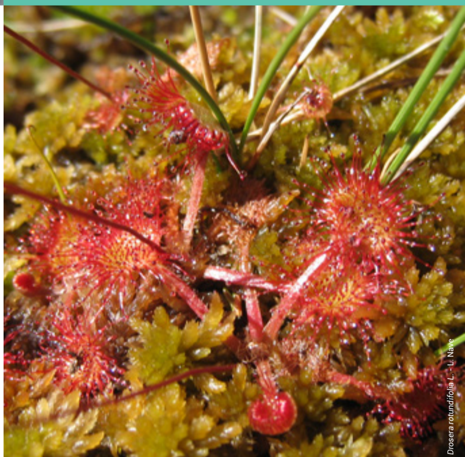
Drosera rotundifolia L. - L. Nave

Per la vulnerabilità di questo ambiente si prega di non uscire dai sentieri segnalati.