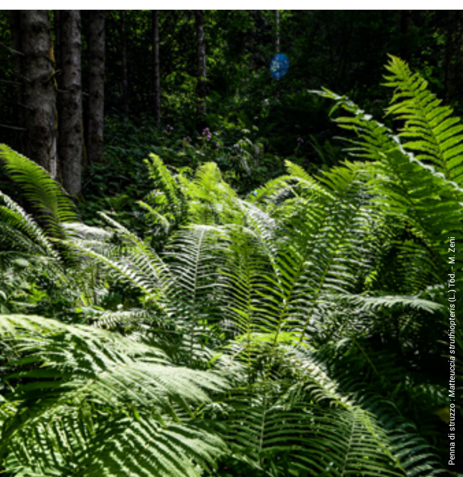
Penna di struzzo: Matteuccia struthiopteris (L.) Tod. - M. Zeni

Una pianta insolita che qui e in poche altre zone del Parco è così abbondante.