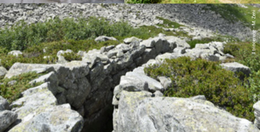
Il trincerone - M. Zeni