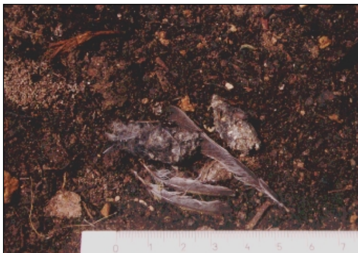
Fig. 1 – Civetta nana: borre e spiumata di Regolo ( Regulus regulus ) (Foto L. Marchesi).

Allocco degli Urali ( Strix uralensis ) . Specie recentemente scoperta come nidificante nel territorio nazionale in Friuli Venezia Giulia, al confine con la Slovenia, con un numero molto ridotto di coppie (BENUSSI ET AL. 1997). Recentemente osservato per un periodo piuttosto prolungato all'interno della foresta del Cansiglio (MEZZAVILLA DATI INED.).