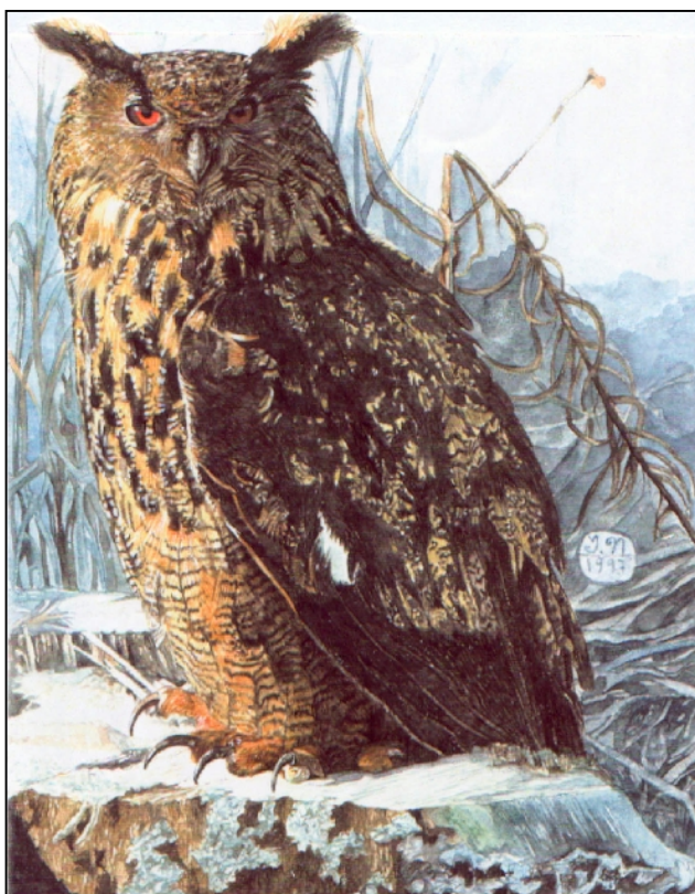
GUFO REALE, disegno di Isa Nebi

Relazione del secondo anno di attività (2000)