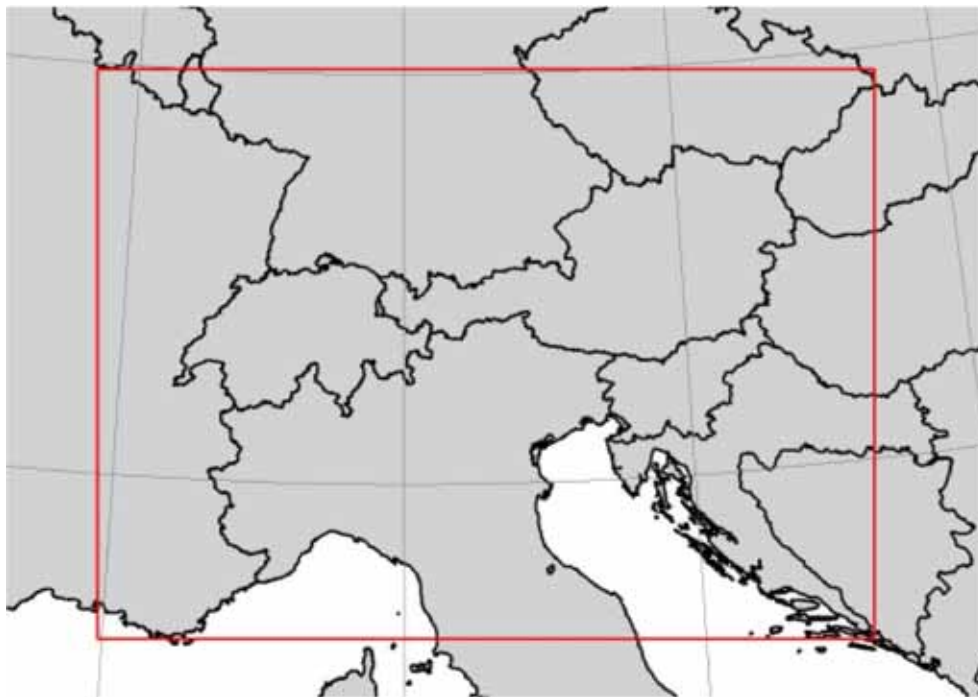
Figura 1: Collocazione geografica e confini dell'area di studio.

L'area individuata per l'elaborazione e l'applicazione del modello include l'intero territorio dell'Austria e della Slovenia e la porzione alpina del territorio italiano compreso tra la Lombardia e i confini delle due nazioni citate (Figura 1). Approssimativamente, tale area si estende tra 4°E e 18°E di longitudine e tra 43°N e 50°N di latitudine.